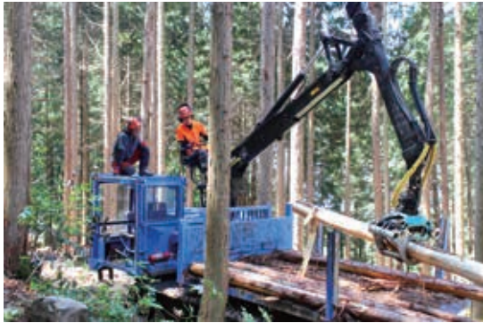
フォワードによる運材作業