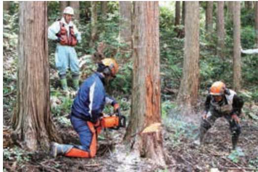
チェンソーを使用した伐倒作業

材作業では、丸太を傷つけないよう慎重に操作していました。林業の現場を体験することができ、高校生にとって貴重な体験になったと思います。